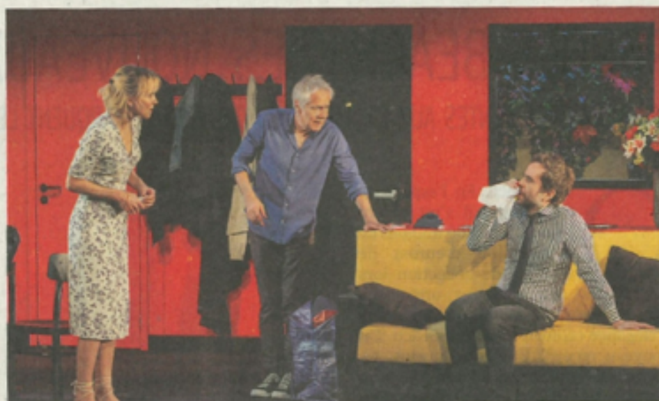
Les comédiens s'amuse-ment dans toutes les pièces de la mai- son et de bas en haut.